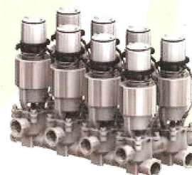
省エネ・省人・自動化を実現 「サニタリー機器・装置」