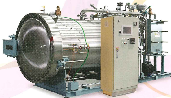
含気チルド製品の処理も可能 「殺菌機」