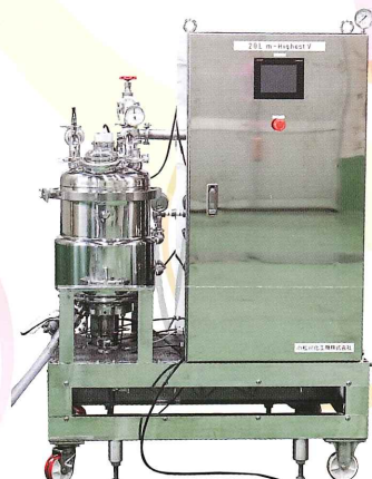
強力なミキシングで 短時間処理が可能 「真空ミキサー」