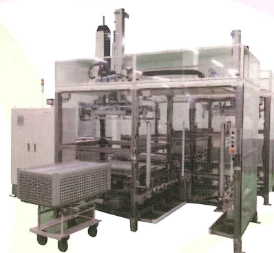
省人化を実現 「レトルト用FAシステム」