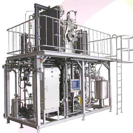
発泡性の強い液でも濃縮可能 「フラッシュ式濃縮装置」